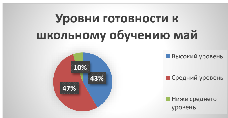
Рис.1 Уровни готовности к школьному обучению